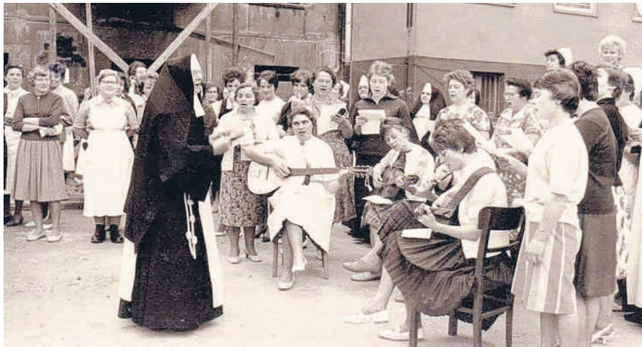
Auch Feste wurden im Sülzer Kinderheim gefeiert. Viele ehemalige Heimbewohner erinnern sich aber eher an die Gewalt.

Die Geschichte des Sülzer Waisenhauses in den 50er und 60er Jahren ist eine Geschichte des kollektiven Versagens. Nicht alle Nonnen haben geprügelt. Die, die es nicht taten, trugen aber offenbar wenig dazu bei, die Missstände aufzuklären. Weltliche Erzieher und Lehrer, die auch auf dem Gelände arbeiteten, der Heim-Direktor, die Heimaufsicht: Sie alle wussten nichts oder schwiegen.