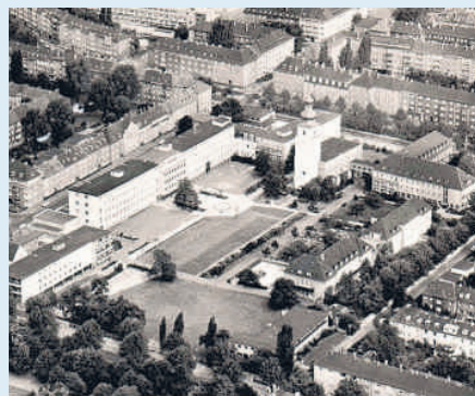
Luftaufnahme des mittlerweile abgebrochenen Kinderheims

wurden in den 70er Jahren die Leitziele des Hauses geändert. Das Kinderheim sollte nun keine Ersatzfamilie mehr sein, sondern ein Aufenthaltsort zur Zeit. Nach einem Wechsel an der Spitze des Heims – auf Josef Abeln folgte Rolando da Costa Gomez – verließen im Jahr 1973 die Schwestern das Heim. Sie wurden durch weltliche Kinderpflegerinnen ersetzt. Vereinzelte Übergriffe auf Kinder hat es aber noch vor 15 Jahren gegeben.